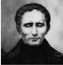
מתוך ויקיפדיה העברית